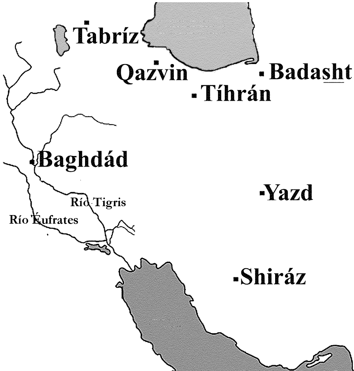
MAPA DE PERSIA